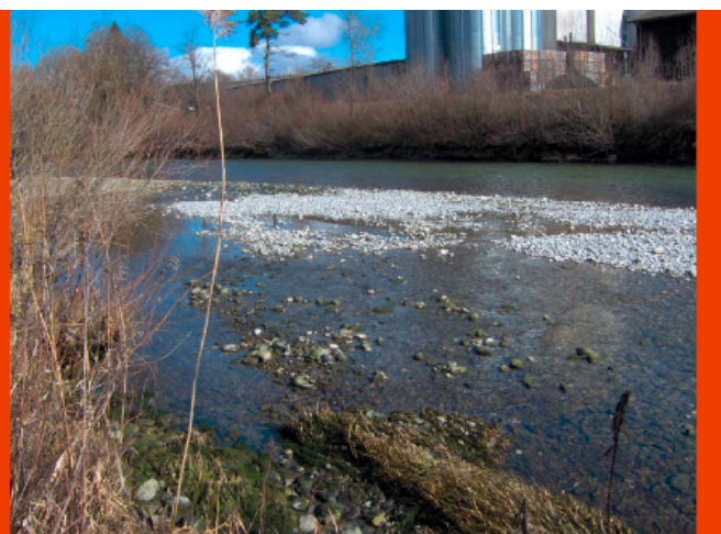
Débit plancher 16 m 3 /s