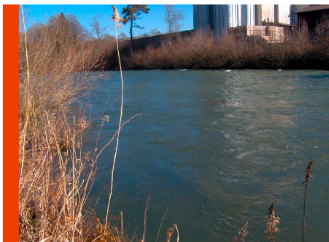
Débit d'éclusée 150 m 3 /s

Avec leur gestion par éclusées, plus de 100 centrales hydro électriques de Suisse provoquent chaque jour des crues artificielles. Elles détruisent ainsi la faune et la flore et menacent les personnes. la Fédération Suisse de Pêche exige des cantons qu'ils contraignent les opérateurs des centrales hydro électriques à l'assainissement de leurs installations – conformément au mandat légal!