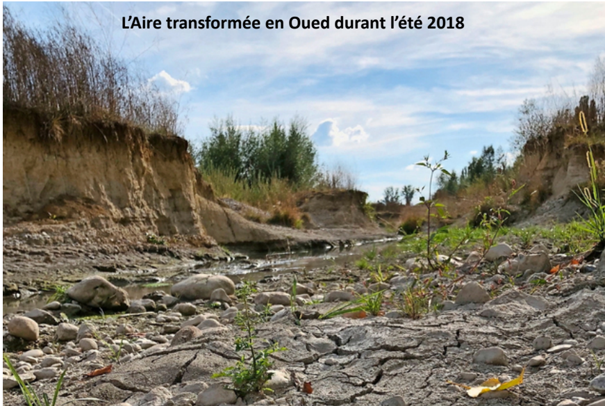
L'Aire transformée en Oued durant l'été 2018