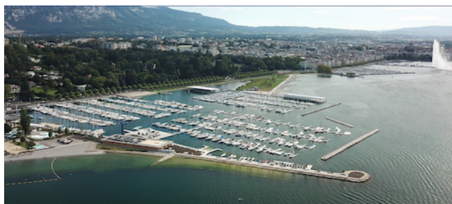
La fameuse « digue Nord » au premier plan